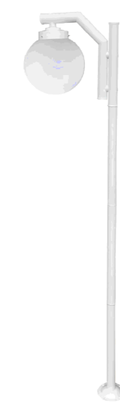
MODELO DE POSTE S/ ESCALA