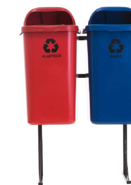
MODELO DE LIXEIRA S/ ESCALA

*OBS: CONFERIR ESPECIFICAÇÕES NO MEMORIAL DESCRITIVO