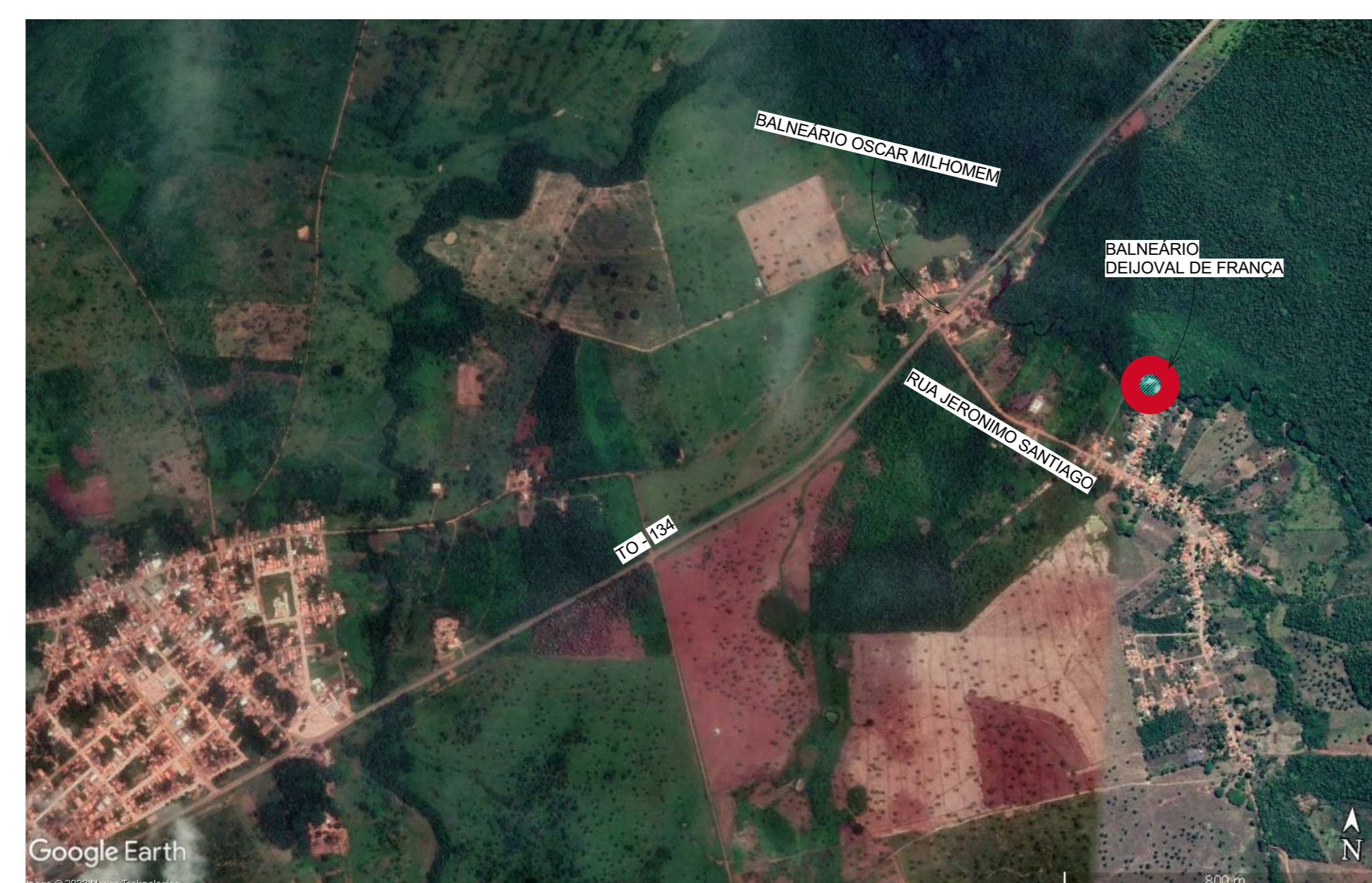
3 PLANTA DE LOCALIZAÇÃO ESCALA - 1 : 3500

COORDENADAS: LATITUDE: 6° 1'13.52"S LONGITUDE: 47°54'5.06"E