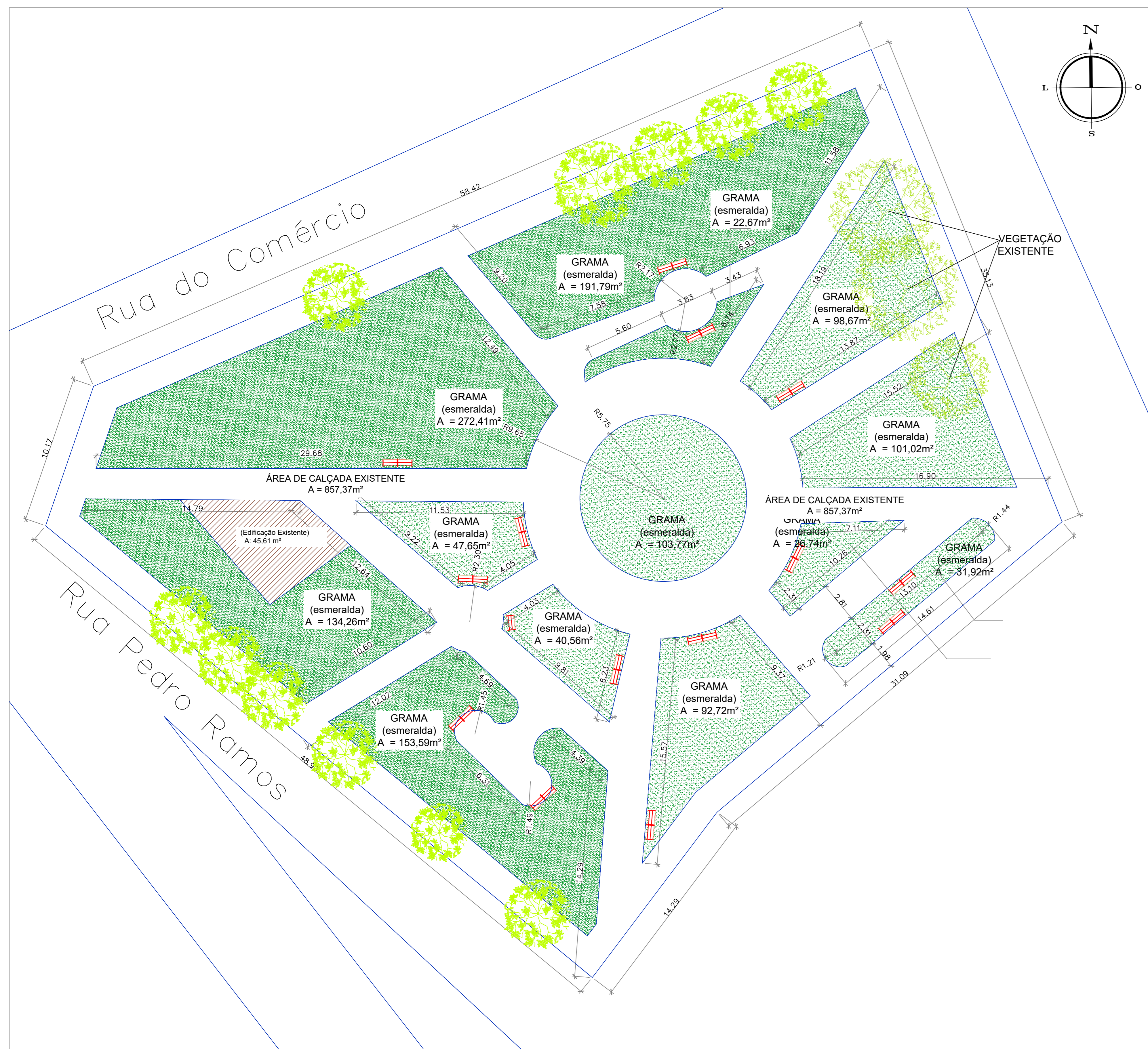
PLANTA BAIXA EXISTENTE - PRAÇA ESCALA: 1:150