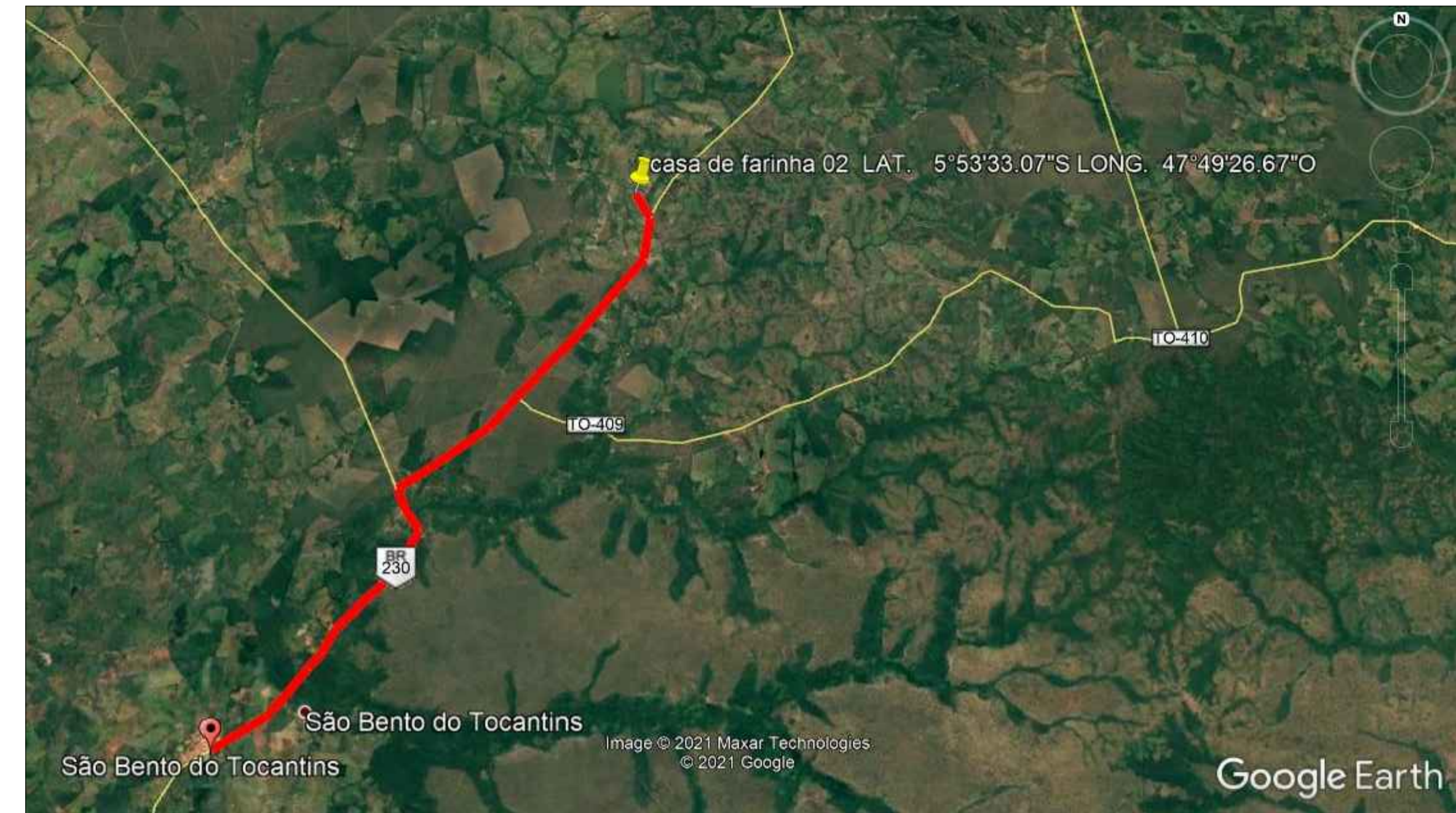
LOCALIZAÇÃO CASA DE FARINHA P.A. VINÍCIUS SEM ESCALA